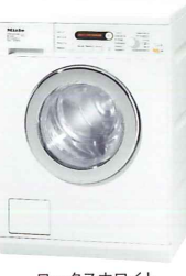
ロータスホワイト

外形寸法:W595×D603×H848～863mm (主な仕様) ・洗濯・脱水容量7.0kg ・最大脱水回転数1200rpm ・洗濯温度:水～90℃ ・12種類の洗濯プログラムを搭載 ・標準使用水量68L、標準消費電力0.77kWh、 運転時間129分 ・操作パネル角度:正面フラット ・ビルトイン、単独置き、2段積み可能 ・右ヒンジ